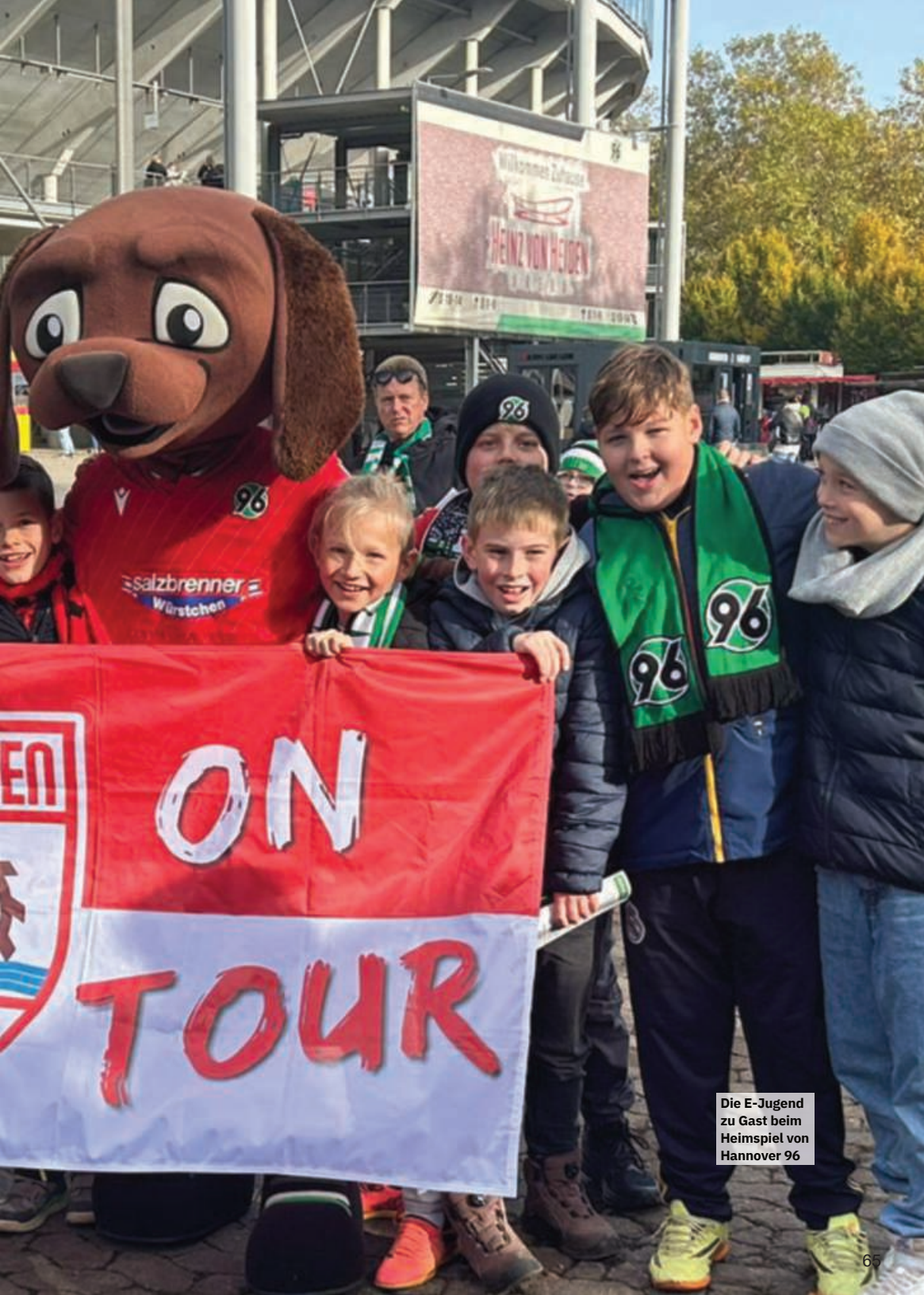
Die E-Jugend zu Gast beim Heimspiel von Hannover 96