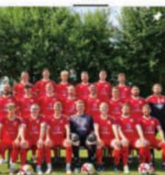
1.HERREN 1.Kreisliga Hameln-Pyrmont SAISON 2025/26