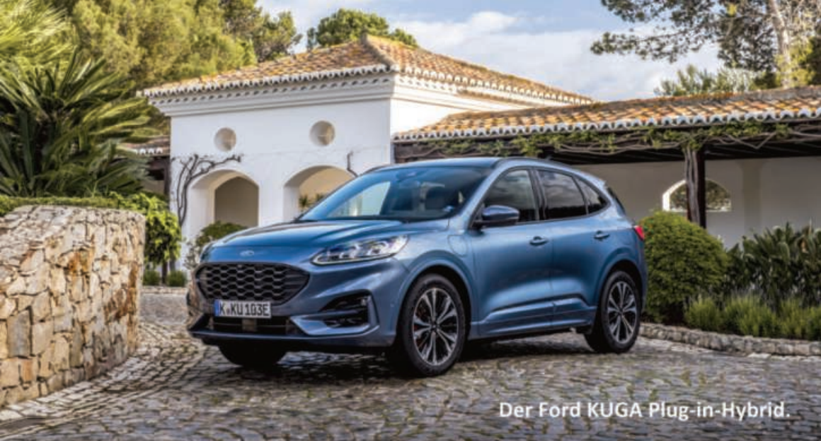
Der Ford KUGA Plug-in-Hybrid.