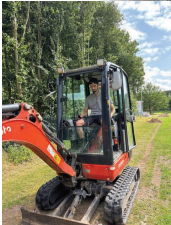
Auch Bagger kommen immer wieder mal am Sportplatz zum Einsatz

nach oben für beide Herrenteams. Wichtig ist es, sich auch neben dem Fußball als Mannschaft zu finden und die neuen Gesichter schnell davon zu überzeugen, dass sie sich dem richtigen Verein