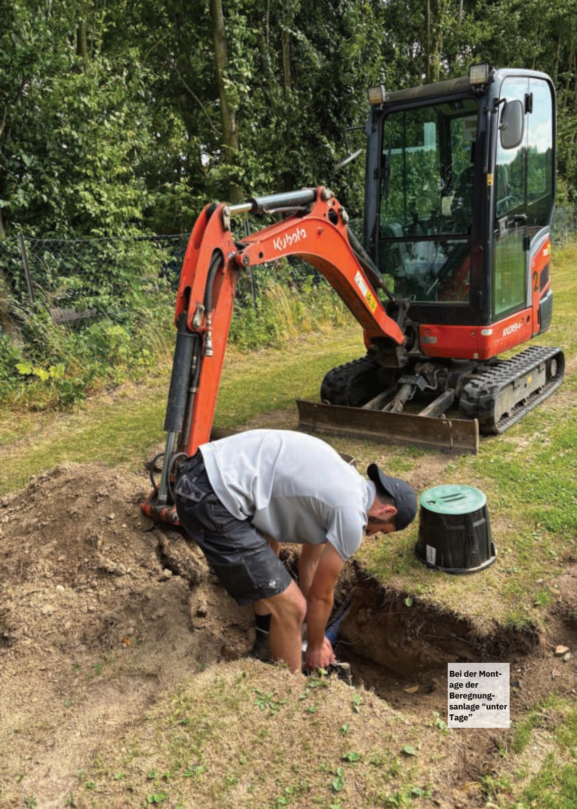
Bei der Montage der Beregnungsanlage "unter Tage"