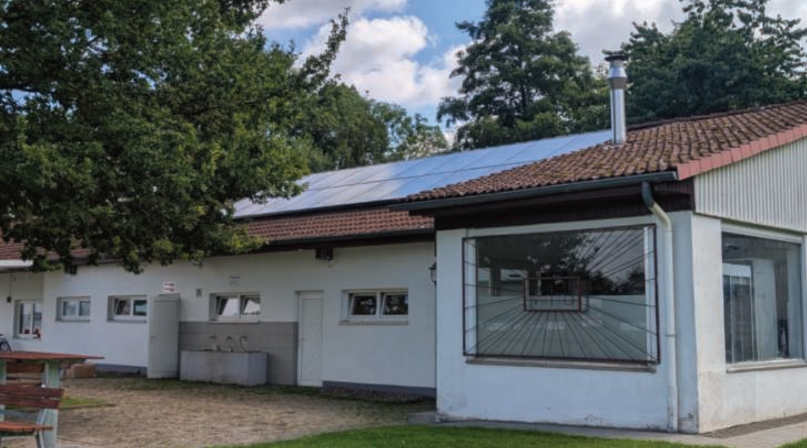
Die neue PV-Anlage auf dem Dach unseres Sportheims

erreicht werden, sodass neben der Wassereinsparung (durch Wasserspeicherung in einer Zisterne) auch eine entsprechende CO 2 -Einsparung erwirkt werden kann. Ohne eine Förderung unseres Vorhabens ist eine entsprechende Umsetzung einer solchen Anlage für uns aus finanziellen Gründen nicht möglich. Die Vielzahl unserer Mannschaften erfordert zudem einen robusten Rasen um allen Teams eine gute Grundlage für die Ausübung unseres Sports anzubieten. Durch die intelligente Bewässerungsanlage werden die Ziele erreicht.