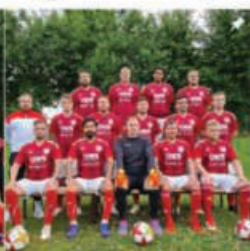
2.HERREN 3.Kreisliga Hameln-Pyrmont SAISON 2025/26